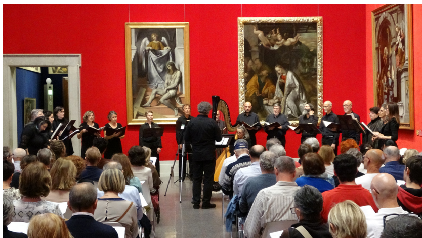
I Cantores nella sala rossa della Pinacoteca Tosio Martinengo

Visto il potenziale evocativo che le precedenti edizioni hanno avuto nel dare maestosità con il canto alla Basilica di San Salvatore e al Coro delle Monache , Fondazione Brescia Musei e il Gruppo Vocale "Cantores Silentii" hanno intrapreso un nuovo percorso rinnovando il format e invadere altri spazi museali cittadini. La Rassegna di quest'anno si terrà nell' Auditorium di Santa Giulia (la chiesa cinquecentesca che ha ospitato il Museo dell'Età cristiana), ora Sala monumentale adibita agli eventi.